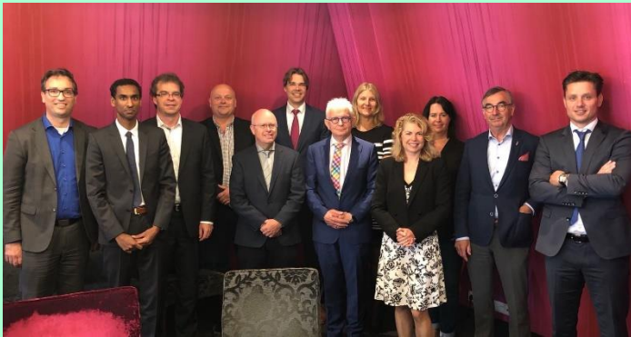
Foto: Aanwezigen ondertekening intentieverklaring

Om de pensioenen te kunnen overdragen is een collectieve waardeoverdracht (hierna: CWO) noodzakelijk. Dit is een zeer intensief traject, waarin alle afspraken vastgelegd worden. Pensioenfonds Cindu is wettelijk verplicht een aanvraag tot goedkeuring CWO in te dienen bij De Nederlandsche Bank (hierna: DNB) en een adviesaanvraag in te dienen bij het verantwoordingsorgaan (hierna: VO). DNB heeft vervolgens drie maanden de tijd om de CWO-aanvraag te beoordelen. Pas na formele goedkeuring door DNB kan de overdracht plaatsvinden.